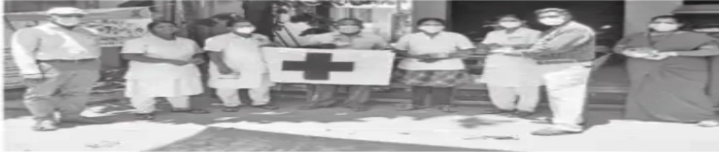
புதுச்சேரி குயவர்பாளையம் ககதார மையத்தில் செஞ்சிலுவை சங்க தினத்தையொட்டி, செவிலியர்களுக்கு முகக் கவசங்களை வழங்கிய அந்தச் சங்கத்தினர்.

புதுச்சேரி, மே 8: புதுச்சேரியில் கரோனா பரிசோதனை பணியில் ஈடுபட்டுள்ள சுகாதாரப் பணியாளர்களுக்கு செஞ்சிலுவை சங்க தினத்தில் பாதுகாப்பு சாதனங்கள் வழங்கப்பட்டது.