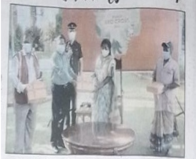
உலக செஞ்சிலுவை தினத்தையொட்டி தன்னார்வலர் களுக்கு தூய்மைப்பொருட்களை கவர்னர் தமிழிசை சுவந்தாராஜன் வழங்கிய போது எடுத்த படம்.

செஞ்சிலுவை தினம் முன்னதாக புதுச்சேர் கவர்னர் மாளிகையில் உலக செஞ்சிலுவை தினம் நேற்று கொண்டாடப்பட்டது. திகழ்ச்சியில் கவர்னர் தமிழிசை சுவந்தாராஜன் செஞ்சிலுவை சங்க தன்னார் வலர்கள் மற்றும் பயனாள் களுக்கு தூய்மைப்பொருட் கள் அடங்கிய பெட்டியை வழங்கினார்.